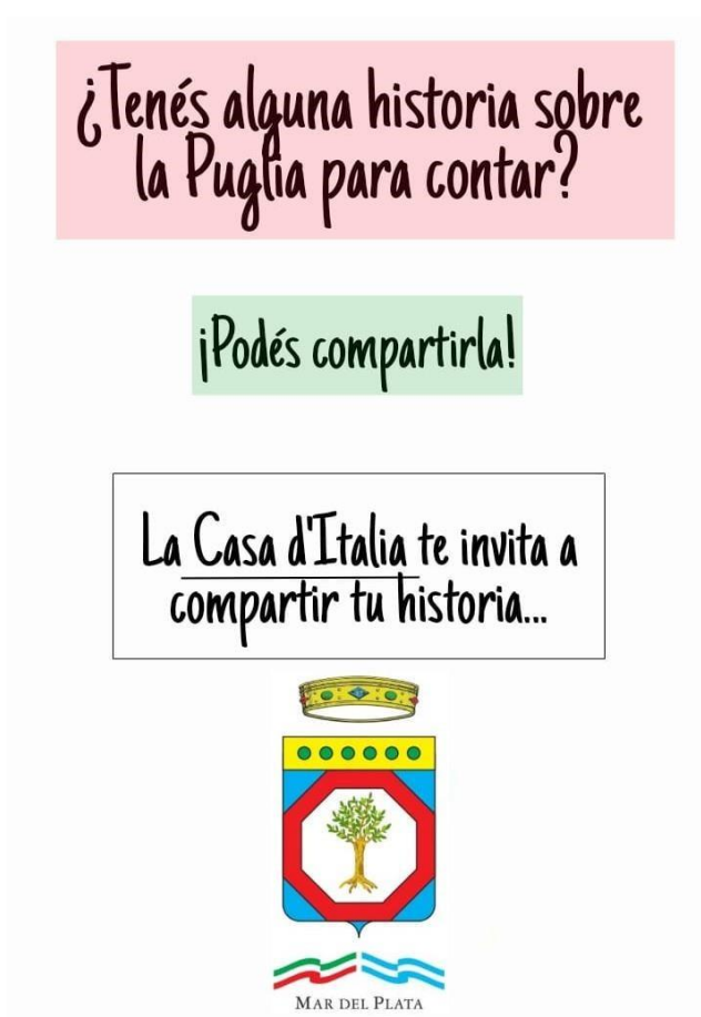
Imagen de redes para convocar a gente que dicte la charla:

Además, el centro enviará un e-mail para que la Casa d'Italia lo reenvíe a todas las asociaciones italianas que conozca y los invite a participar.