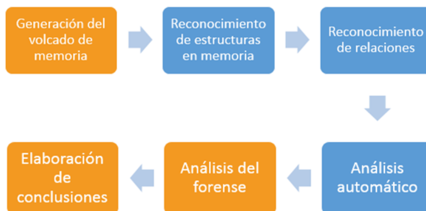
Fig. 1. Esquema reducido del proceso de análisis forense de memoria principal

En la Figura 1 se puede observar un ejemplo de esquema reducido de un procedimiento completo de análisis forense en memoria principal.